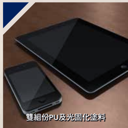
雙組份PU及光固化塗料